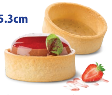
Art-Nr.7389135 1 box: 144 pieces デザートタルト フィリグラノーベーカリー ヴィーガンラウンド 5.3cm Dessert-Tartelettes Filigrano Bakery Vegan Round 5.3cm