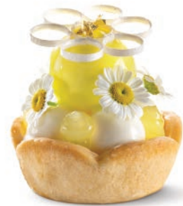
Art-Nr.7396135 1 box: 184 pieces デザートタルト フラワー 5cm Dessert-tartelettes Flower 5.0 cm